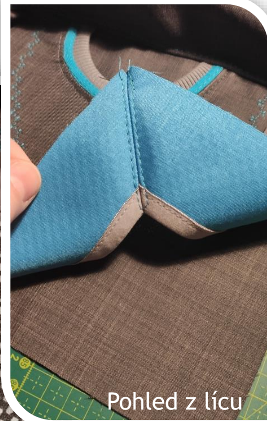
Pohled z lícu